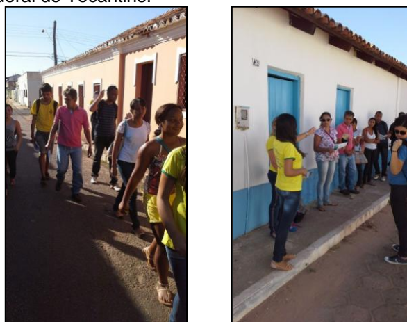
Figura 2 e 3. Percurso turístico histórico-cultural com os acadêmicos do curso de geografia da Universidade Federal do Tocantins.

No final do percurso, os acadêmicos avaliaram tanto o mapa quanto o percurso. No geral o mapa e o percurso foram bem vistos pelos acadêmicos, foi possível observar através das respostas, que os estudantes entenderam o a importância do mapa e do percurso para o núcleo histórico, que é para facilitar a localização dos turistas e para um breve conhecimento de parte da história, geografia e arquitetura de cada atrativo turístico.