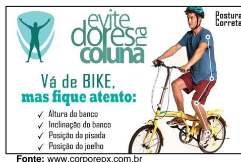
Figura 2. Exemplo da relação de malefício entre bicicleta e saúde, veiculada pela mídia.