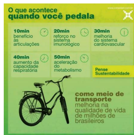
Figura 3. Exemplo da relação de benefício entre bicicleta e saúde, veiculada pela mídia.