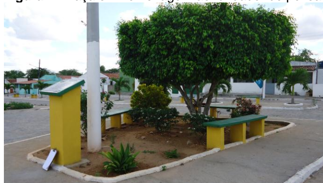
Figura 3. Area de cultivo próximo ao canal do sertão.

Figura 2. Praça em homenagem ao fundador do povoado.