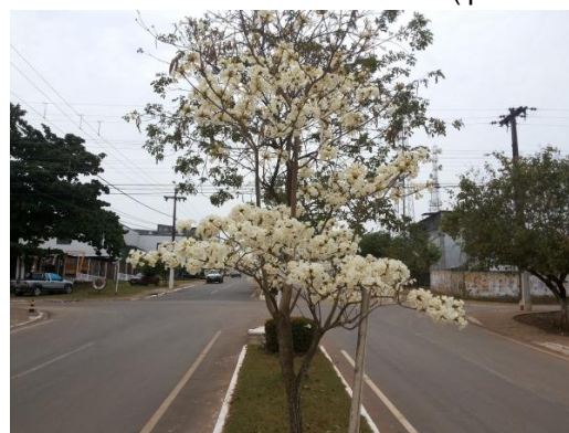
Figura 1. Vista geral da Avenida Clóvis Arraes, em destaque um indivíduo de H. roseo-albus (ipê branco).

A arborização urbana deve ser incentivada no município de Ji-Paraná, com efeitos diretos na redução da incidência solar, deixando mais agradável a sensação térmica, auxiliando na diminuição de efeitos sonoros ajudando na ornamentação da cidade.