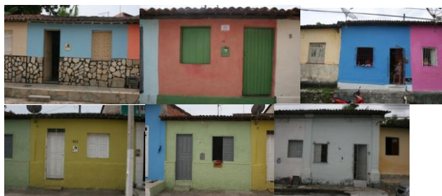
Figura 2. Casas populares – Centro Histórico de Laranjeiras