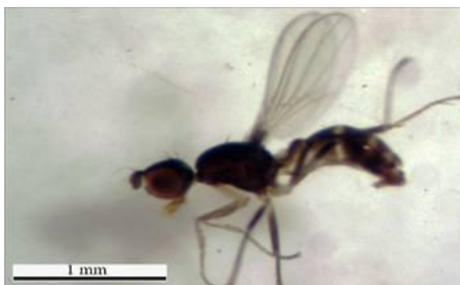
Figura 3 – Indivíduo da família Sepsidae ( Archiseopsis sp.) associado a flores de Aristolochia galeata , na reserva Biológica Unilavras Boqueirão. (foto Thiago Marinho).

representados principalmente por Megaselia sp.. Este gênero é comumente encontrado em flores de Aristolochia argentina (Trujillo & Sérsic, 2006). Segundo Rulik e colaboradores (2008), espécies de Phoridae são polinizadores potenciais por carregarem pólen em seu corpo. Muitas espécies do gênero Megaselia ocorrem em uma ampla variedade de materiais biológicos em decomposição de origem animal e vegetal (Robinson, 1971) o mesmo acontece com Archiseopsis sp. (Sepsidae) comumente encontrada em fezes bovinas (Amaral, 1996) e provavelmente por isso visite enganosamente flores de Aristolochia galeata que exala odor semelhante a estrume de porco. Assim as espécies avaliadas neste estudo são provavelmente atraídas pelo odor fétido que a flor libera durante a sua ântese (Faegri and van der Pijl, 1979). Todas as flores coletadas apresentavam odor fétido e os insetos abrigavam-se na região mais profunda da corola, junto ao estigma da flor.