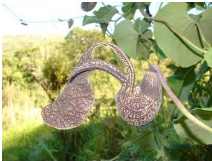
Figura 1 – Flor de Aristolochia galeata na Reserva biológica Unilavras Boqueirão

(Magalhães et al. , 2008). Foram coletadas 15 flores de Aristolochia galeata de 3 indivíduos que cresciam próximo a um brejo (figura 1). As flores foram imediatamente ensacadas e levadas a laboratório. Em laboratório a corola foi preenchida com álcool 70% para evitar a fuga dos insetos e seccionada longitudinalmente. Os insetos foram extraídos usando lupa pinças e pincéis. A identificação foi feita em nível de família ou a partir do estabelecimento de morfótipos. A identificação a nível genérico foi feitas utilizando chaves de Amaral, (1996) e Trujillo & Sérsic, (2006). A planta foi identificadas segundo Capellari-Junior (1991).