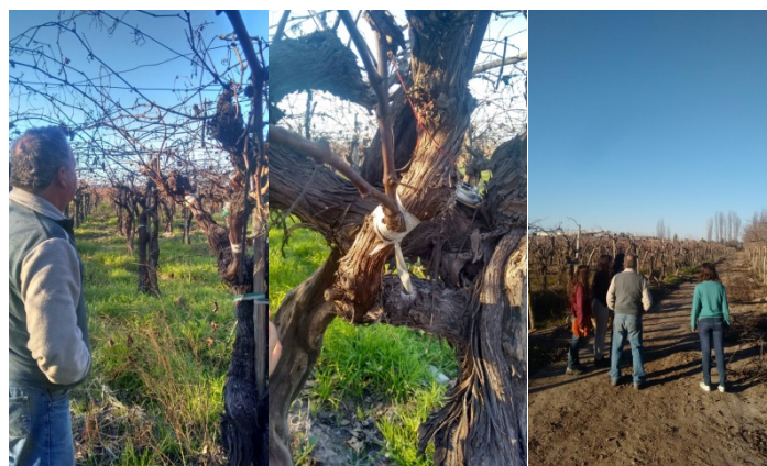
Figura- Diagnostico das plantas e analse.